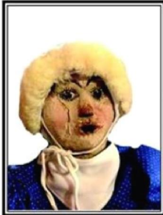
Der Glaube auf ein Wiedersehen in 5 Jahr ist unser Trost.

Du hast viel, ja fast alles gegeben, in Deinem kurzen Leben. Du warst für uns alle das große Glück, wir Fasnachtler, vermissen Dich.